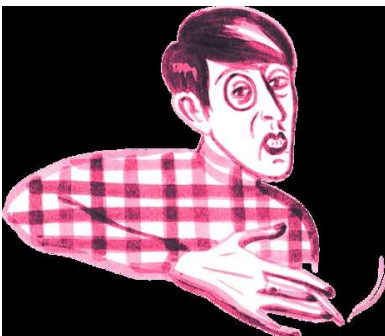
Illustratie vrij naar Otto Dix' Portret van journalist Sylvia von Harden, 1926