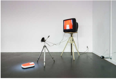
A (De)quantification of the self, Jan Steenman, 2016.